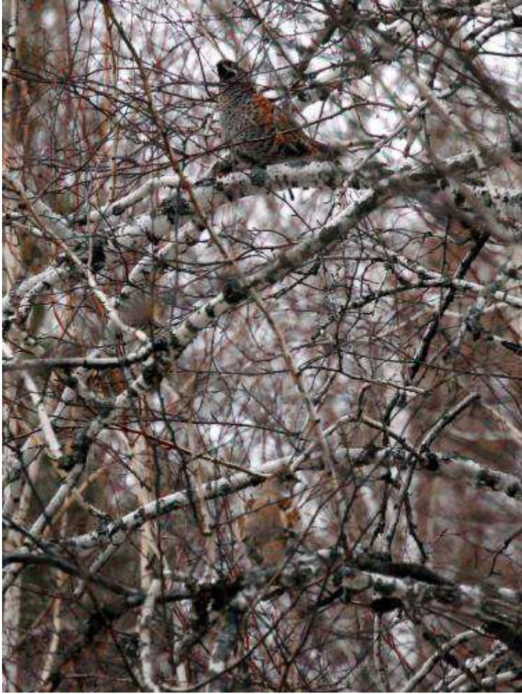
Удалось сфотографировать пение рябушки