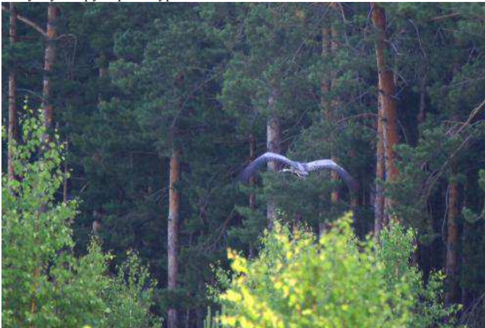
Видал грозу грызунов и мелких птах