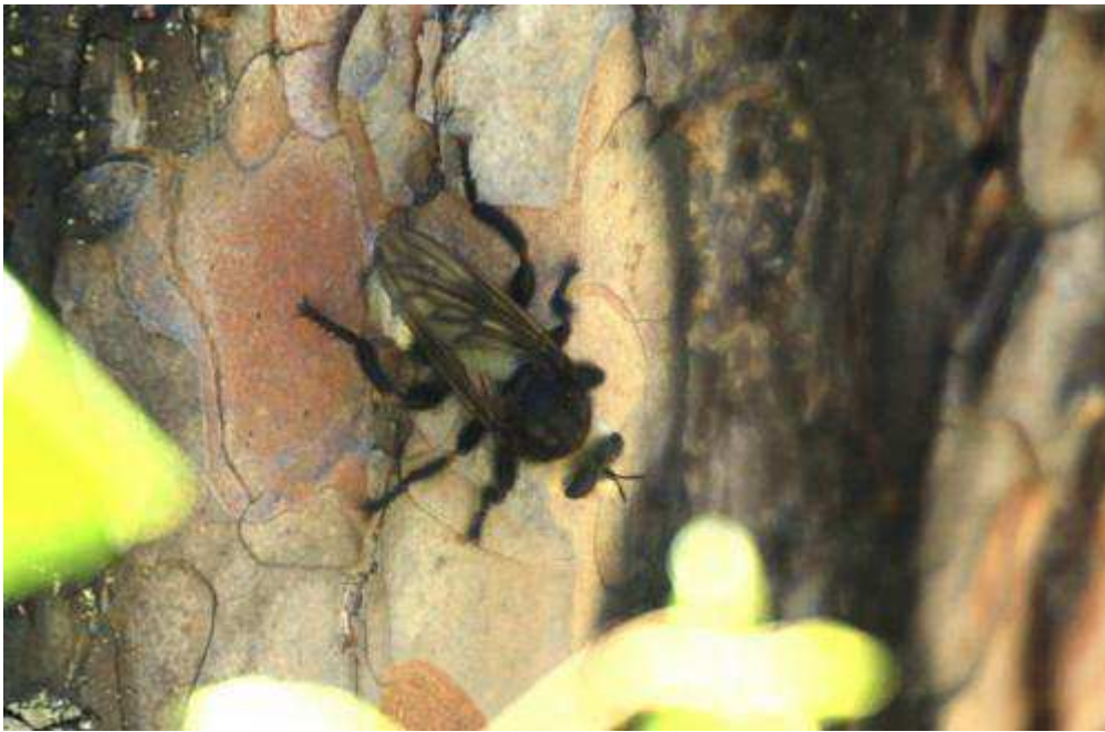
Самец почти в два раза мельче и стройнее.