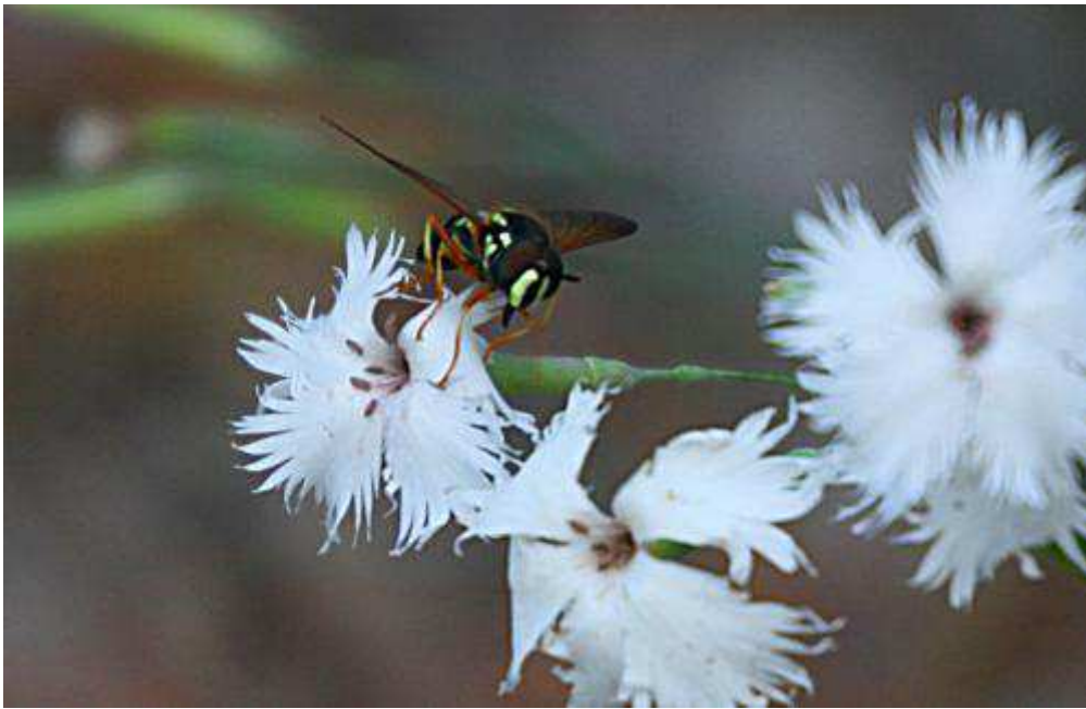
Скрипун продырявленный ( Saperda perforata )