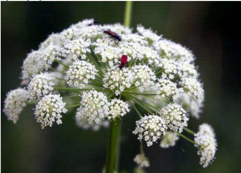
Anoplodera sexguttata - считается, что в в Западной Сибири этот жук не водится