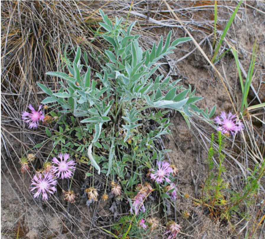
Змеголовник Рюйша - целебное растение, применяется при язвах желудка и двенадцатиперстной кишки, головной боли, колитах, импотенции, ревматизме.