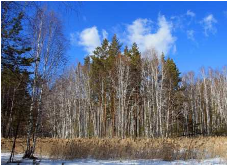
(Болотца с кочкарником)